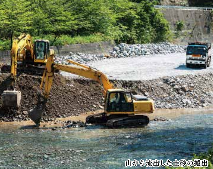
山から流出した土砂の搬出